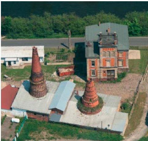
aerial view of lime kilns