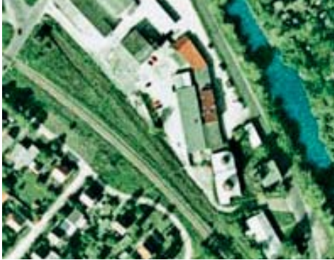
Luftaufnahme, gesamtes Areal