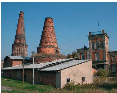
view of lime kilns