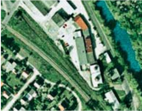
aerial view of site

Utilisation- and Restoration Concept Lime Kilns at The Wriezen Harbour December 2007